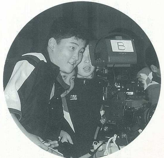
ヤアヤノ本物のカメラはすげえノユメディア号は胸が高なるぞ。