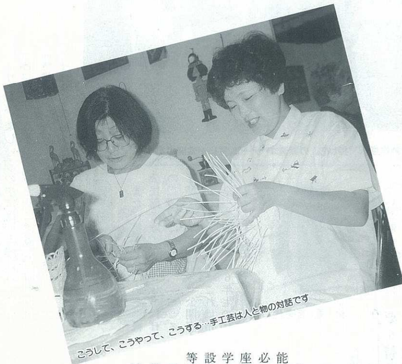
こうして、こうやって、こうする…手工芸は人と物の対話です