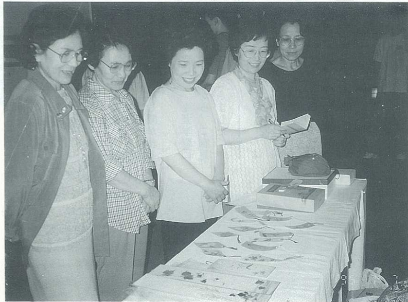
市民の創作展示「押し花」。の実演コーナーは、笑いが満開です。

的にも豊かに生きる。市民が生涯学習の意義を理解し、明るい夢のあるまちづくりができる様、これからの生涯学習推進協議会の活動に、私は大いに期待している。