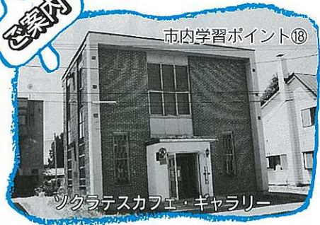
市内学習ポイント⑱