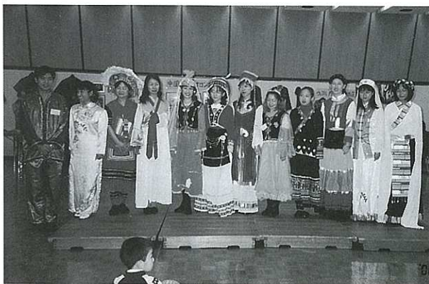
大廟会民族衣装ショー

ずっと、民間による草の根レベルでの交流を進め友好の輪を広げて、今年で満10年を迎えることになりました。