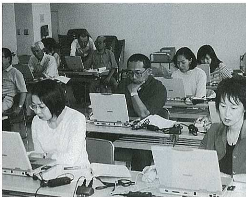
野幌公民館 | IT講習会