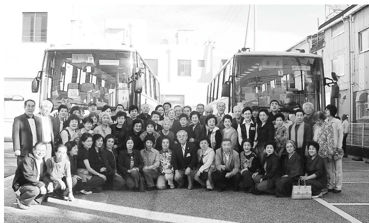
文化交流土佐市訪問団一行