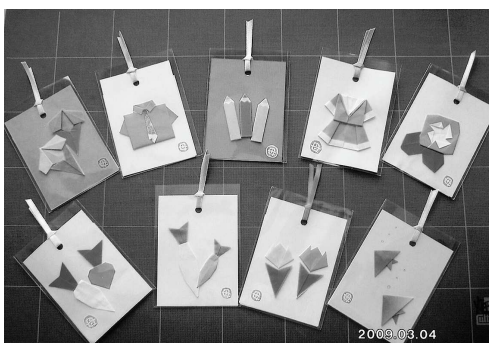
心のこもった「しおり」…かわいいですね!