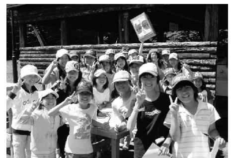
楽しい「こんがり王国」笑顔でハイ、ピース…パチリ!