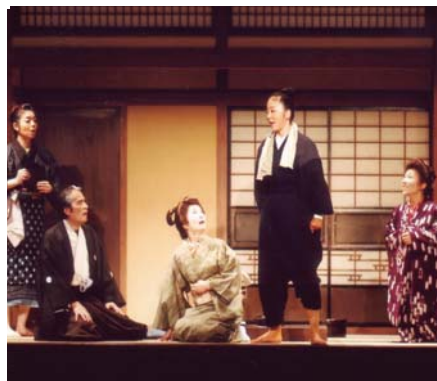
10月「アパッチ砦の攻防」

江別演劇鑑賞会は、江別で魅力ある芝居を観続けていくこと、一九八八年に設立された、会員制の演劇を観る会です。これまで観てきた演劇公演は一一八本を数え、ジャンルは新劇・狂言・歌舞伎・ミュージカルと様々で、会員は年々本、生の舞台を楽しんでいます。