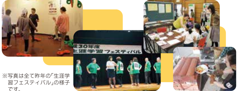
※写真は全て昨年の「生涯学習フェスティバル」の様子です。