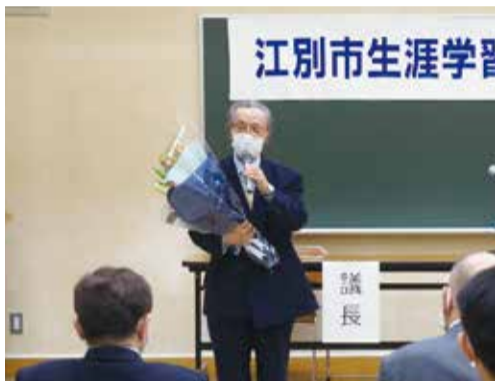
黒川教育長のあいさつ