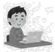
自連協ホームページ