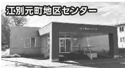
江別元町地区センター

住所: 大麻沢町26-2 電話: 387-0221 管理人: 常駐 駐車場: あり 貸室: 会議室1号(108.0㎡)、会議室2号(82.0㎡)、会議室3号(48.0㎡)、会議室4号(30.1㎡)、和室1号(30.0㎡)、和室2号(30.0㎡)