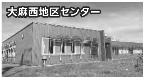
大麻西地区センター